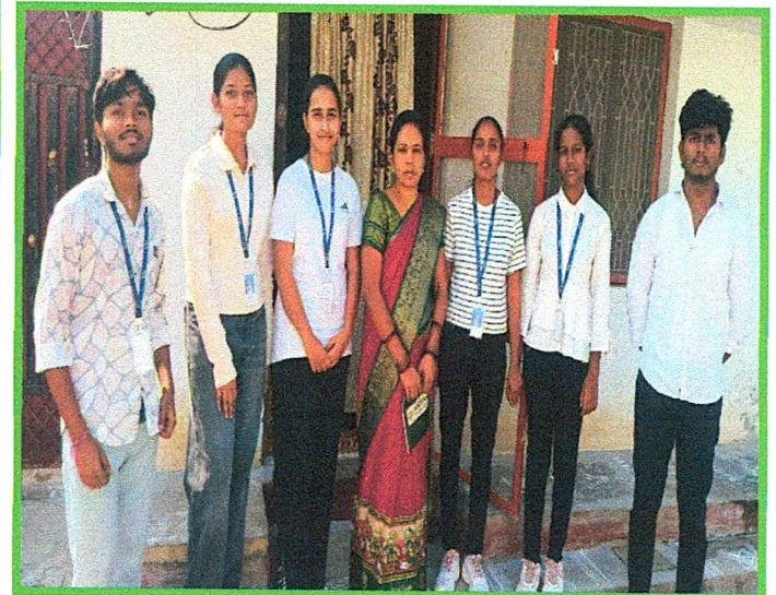
Caption: Save Water, Save Life – Every Drop Matters!